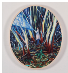
第1回マオイ自由の丘ワイナリー エチケットアートアワードグランプリ 久野志乃(画家)